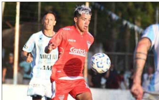
El "Mil Rayitas" eliminó a Argentino de Quilmes.

En un escandaloso partido, que en principio demoró su inicio por amenazas al árbitro y minutos después, por agresiones mutuas en el saludo entre los equipos, fueron amonestados los dos arqueros antes de comenzar las acciones, se definió el Reducido de la Primera B. Los protagonistas fueron Argentino de Quilmes y Los Andes; en "la ida" había vencido Los Andes uno a cero como local y esta era la revancha para definir el ganador del Reducido. Sarmiento de Santiago del Estero, el ganador del Re-