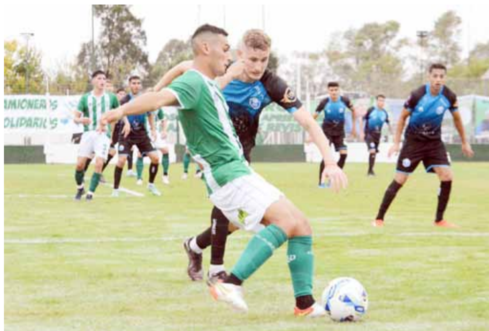
Ciudad - Camioneros, un choque que ya no se verá en la próxima temporada.

Camioneros, el equipo de Esteban Echeverría que jugó este año el Torneo Federal A y fue rival de Ciudad de Bolívar en algunas oportunidades, le comunicó al Consejo Federal de AFA su decisión de no participar en la temporada 2025 de esa misma competencia. Si bien