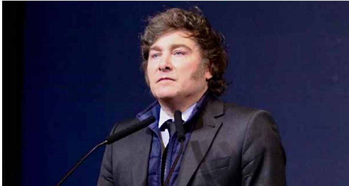
Milei no descansará en las fiestas

El mandatario bajó la orden de "predicar con el ejemplo" y hay lugares vetados para descansar tras el primer año de gestión