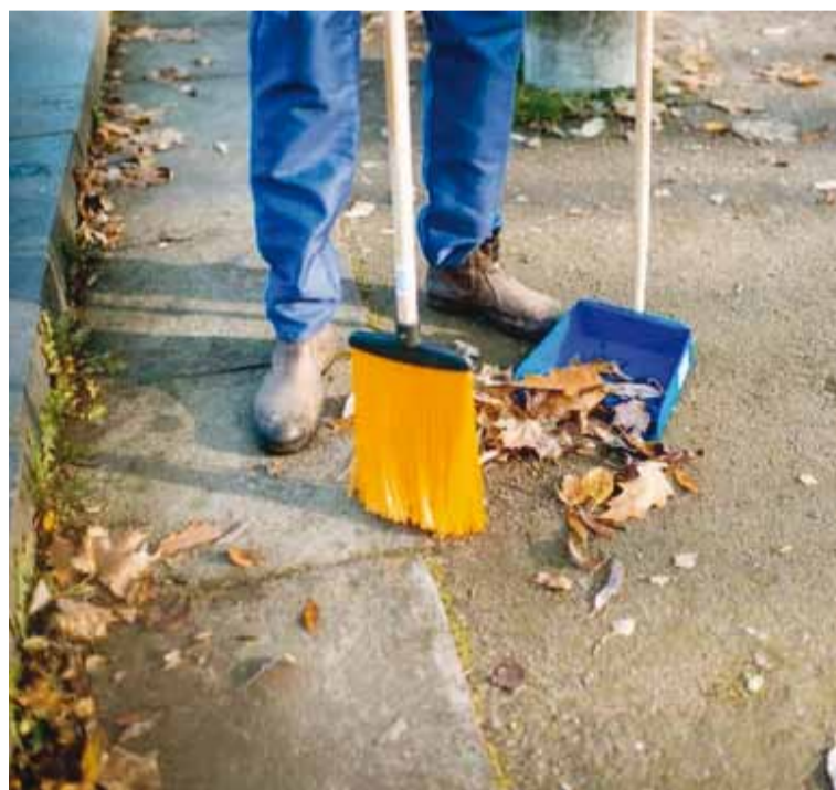
Los delincuentes aprovecharon la oportunidad y le robaron

Los malvivientes se dieron a la fuga casi una hora después y se comprobó que se robaron dinero en efectivo, ropa, perfumes, una computadora y un arma