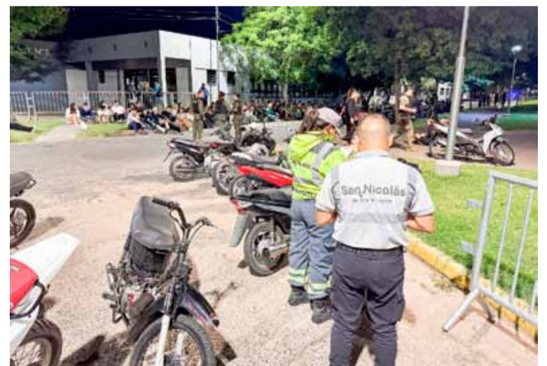
Secuestraron más de 100 vehículos

Según se informó desde el municipio, dicho operativo apuntó a las motocicletas con escapes libres que circulan por las noches, generando ruido y realizando picadas en zonas céntricas y avenidas principales. Las acciones culminaron alrededor de las 6. (DIB)