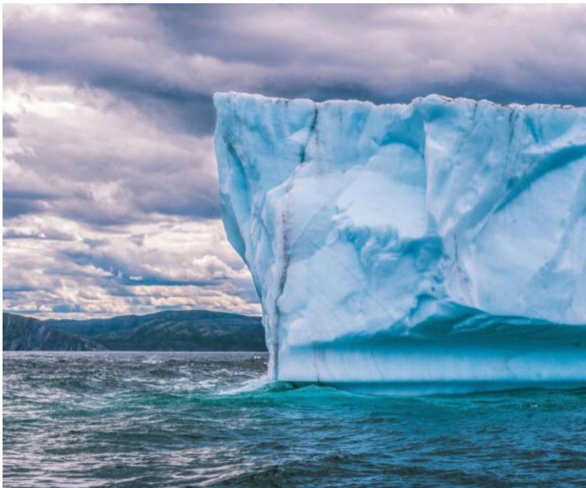
El gran bloque de hielo se movilizó después de 30 años

El A23a mide aproximadamente 4000 kilómetros cuadrados, unas tres veces Nueva York. Pasó 30 años sin moverse