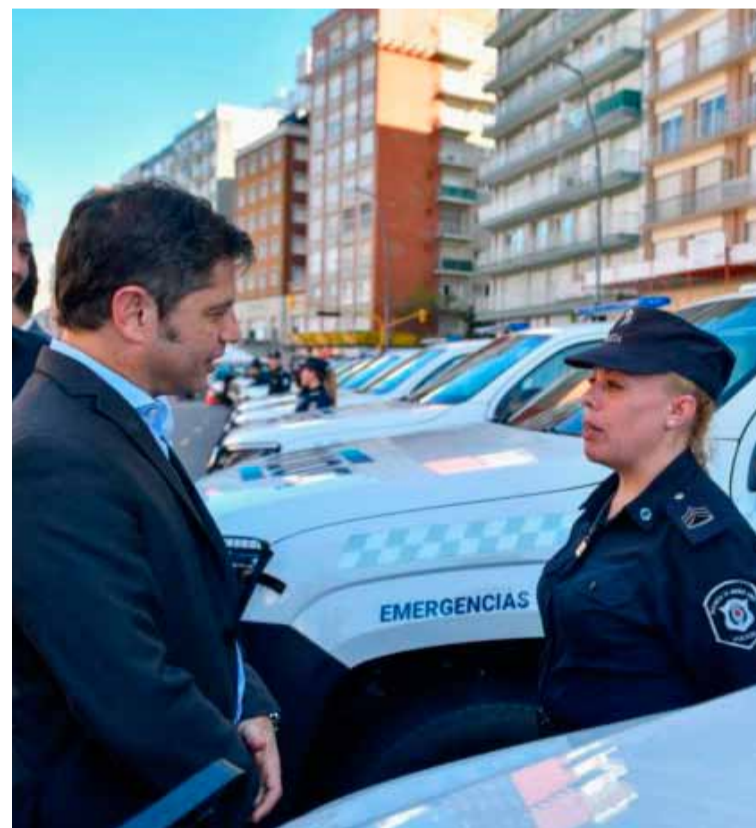
Kicillof estará en Miramar