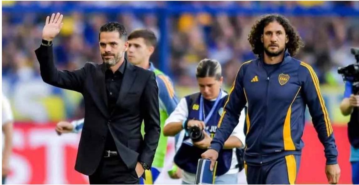
El Boca de Fernando Gago, rumbo al repechaje de la Copa Libertadores 2025

El sorteo será este jueves y allí comenzará a definirse la suerte de todos los equipos argentinos